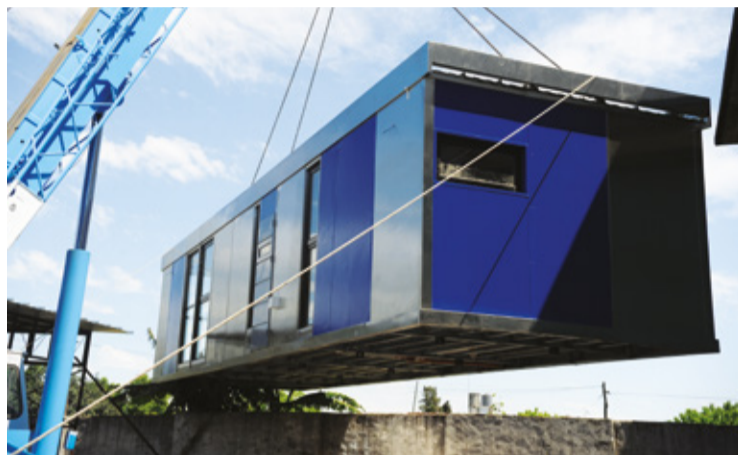
Los hospitales modulares se transportan en secciones completas.

“Nos dedicamos a hacer desarrollo de módulos para todo tipo de usos. Ya hemos realizado muchas unidades vinculadas a la medicina, para uso hospitalario y asistencial, con instalaciones acorde, para cubrir todo el espectro de complejidades, desde áreas de espera y enfermería hasta unidades de terapia intensiva (UTIs), incluido quirófanos. En esta situación de emergencia generada por la pandemia, podemos construir módulos de prevención para tomar muestras